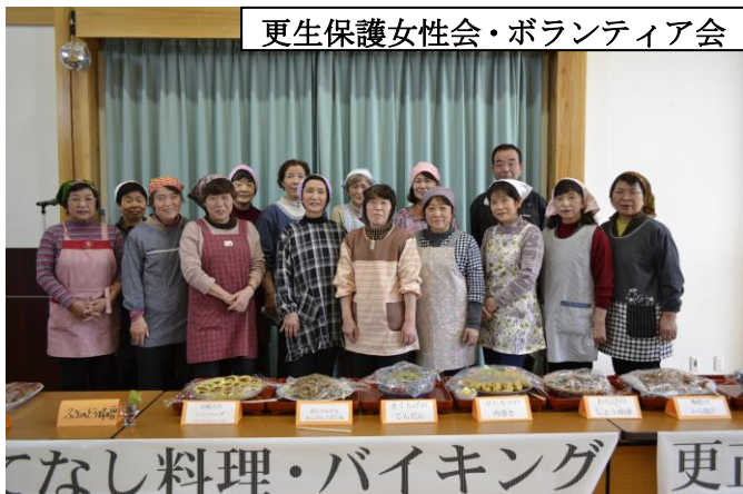
てなし料理・バイキング 更