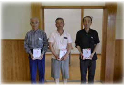
グラウンドゴルフ 第3位