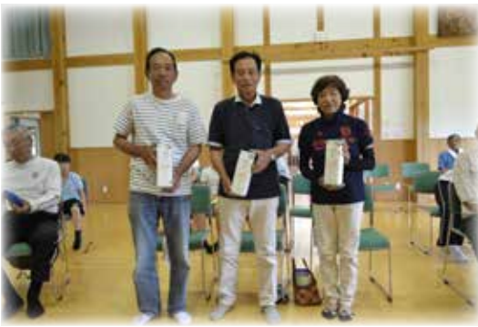
グラウンドゴルフ 第1位

参加された皆様、応援に駆けつけてくださった皆様、運営にご協力いただきました皆さま、ありがとうございました。