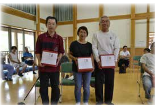
グラウンドゴルフ 第2位